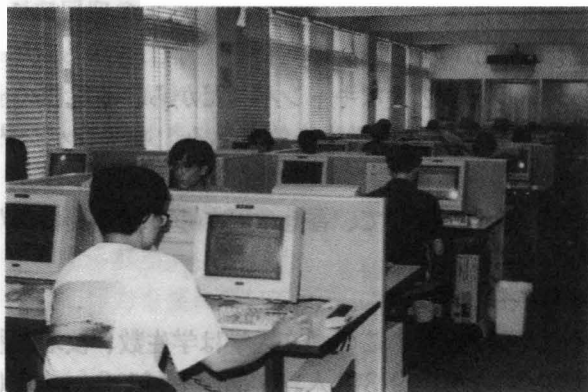
コンピューター授業風景

図書館の利用の仕方とか、コンピューターの基本的操作は1年生で修得すべきものとされ、教養科目として設置されている。