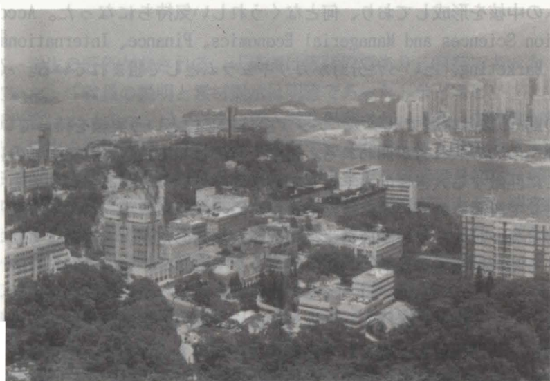
香港中文大学全景

この大学は、1963年香港政府条例の下で設立した私立大学。私立といっても、運営経費の大部分は香港政府の補助でまかなわれている、という特殊な形態。現在は香港の新界・沙田にあり、小高い山の頂上を切り開いた場所にある。大埔海を眼下に望む絶景の位置にある。